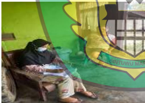
Petani I (64 Tahun)