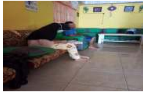
Petani F (47 Tahun)