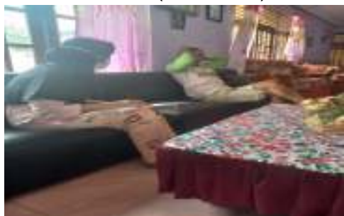
Petani C (62 Tahun)