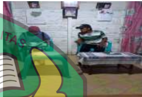
Petani H (58 Tahun)