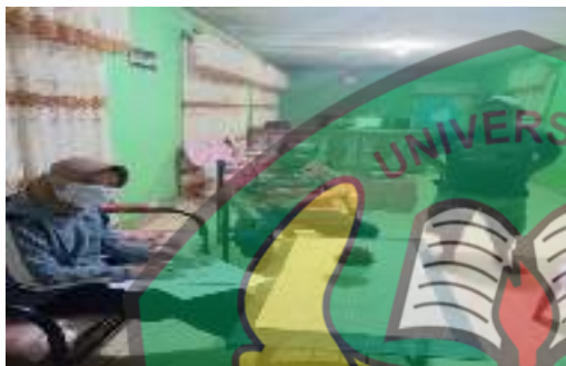
Petani G (48 Tahun)