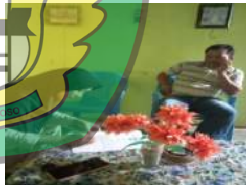
Petani J (48 Tahun)