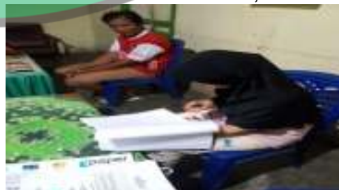
Petani B (46 Tahun)