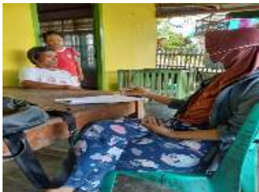
Petani K (64 Tahun)