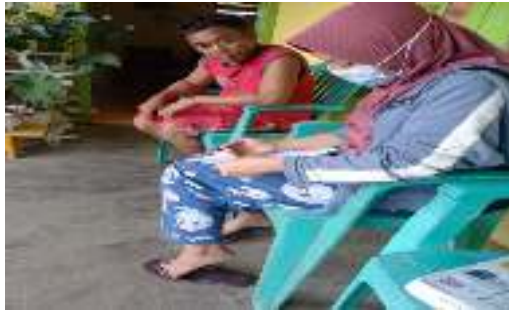
Petani E (41 Tahun)