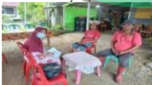
Petani A (50 Tahun)