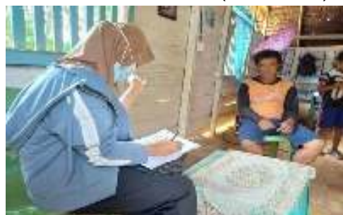
Petani D (43 Tahun)