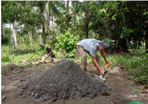
Pencampuran media tanam