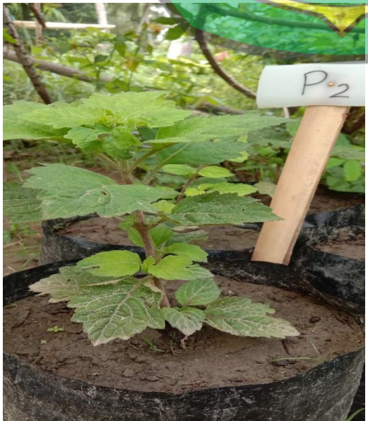
Hasil tidak dinaungi