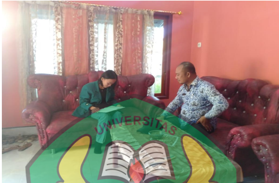
Wawancara Bersama Ketua RT 06