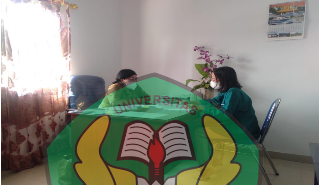
Wawancara Bersama Lurah Lembomawo