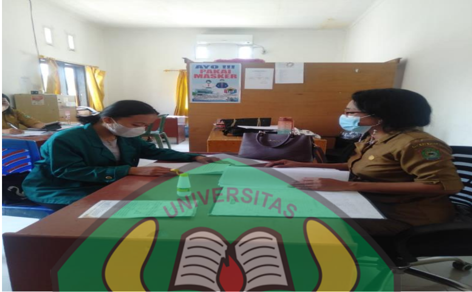
Wawancara Bersama Anggota Seksi Pemerintah dan Pelayanan Umum