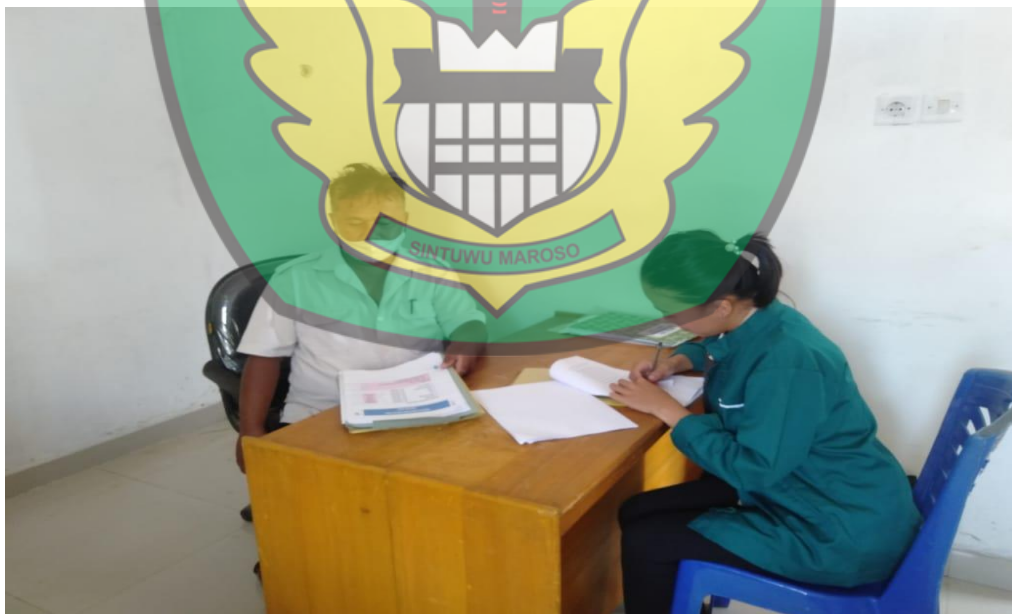
Wawancara Bersama Seksi Ekbang