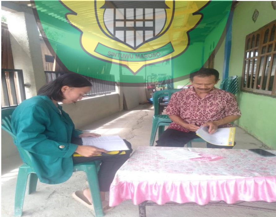
Wawancara Bersama Ketua RT 02