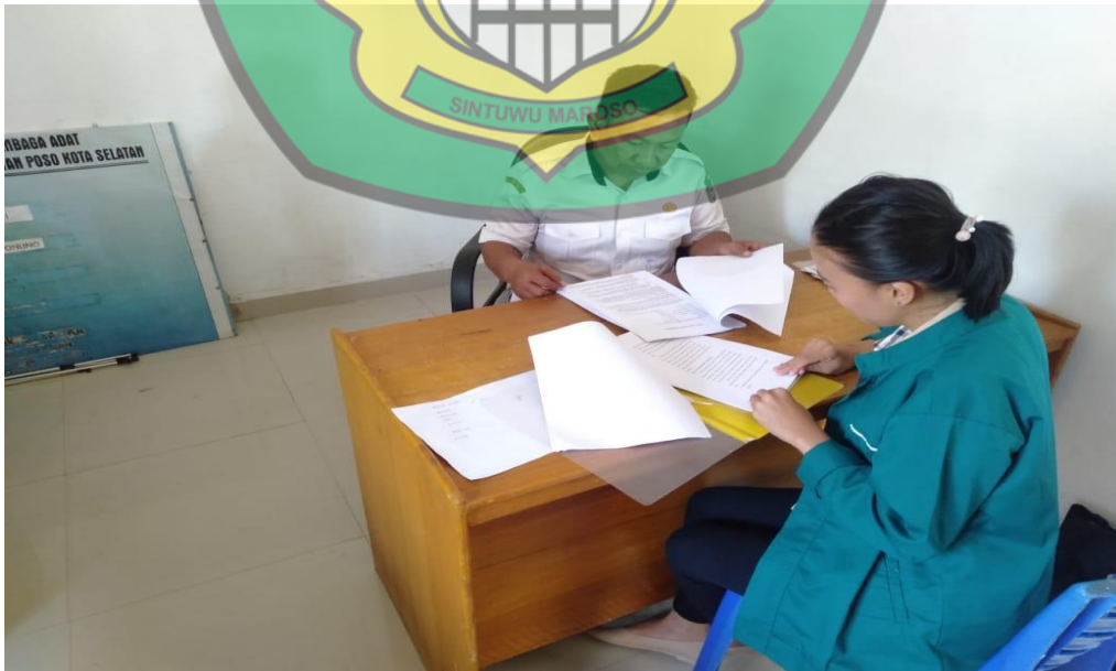
Wawancara Bersama Sekertaris Lembomawo