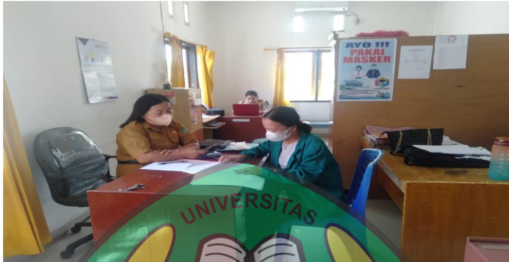
Wawancara Bersama Seksi Ketentaraman dan Ketertiban