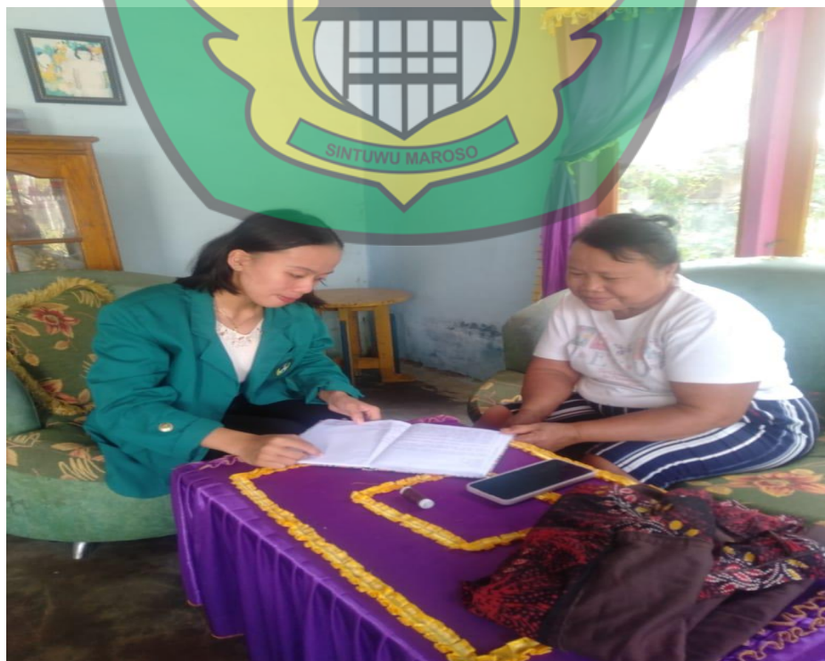
Wawancara Bersama Masyarakat