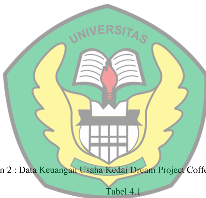
Lampiran 2 : Data Keuangan Usaha Kedai Dream Project Coffee